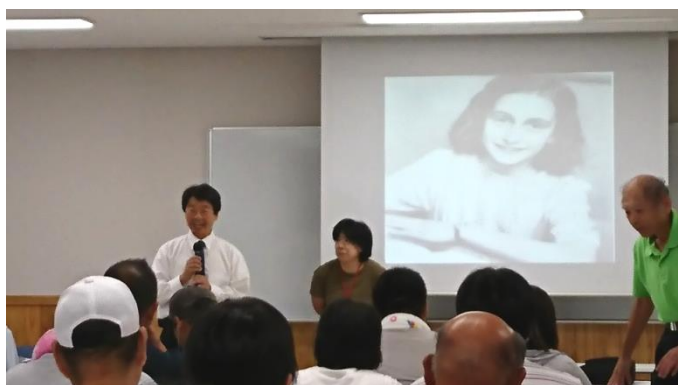
副館長さんからお話しを伺う

午前中の学習会では、ボランティアガイドの方が「アンネの日記」を朗読されるのを聞きながら、当時の写真のスライドを観たり、副館長さんからは当時のヒトラー政権が行ったユダヤ人殺害をはじめ、戦争によって多くの高齢者や子ども、障がいのある人が犠牲になったことについて説明がありました。