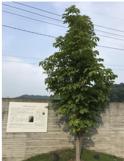
ホロコースト記念館に株分けされた『マロニエの木』

平和学習会での説明と記念館の見学を通して、参加した利用者・職員は戦争の悲惨さを目の当たりにし『平和・命の大切さ』と共に、『今を一生懸命生きることの大切さ』を改めて考えることが出来ました。